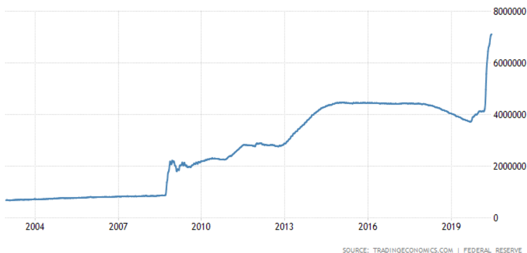
Figura 3: Balanço patrimonial do sistema do Banco Central americano (em milhões de dólares), 2000-2020