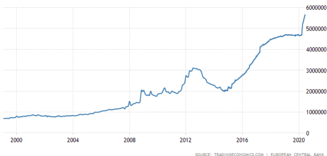
Figura 4: Balanço patrimonial do Banco Central Europeu (em milhões de euros), 2000-2020

Com suas operações com APP, o Banco Central Europeu tem sido expansivo em termos de política monetária nos últimos cinco anos e retomou em 2015 o curso estabelecido em 2008, após a crise financeira (figura 4).